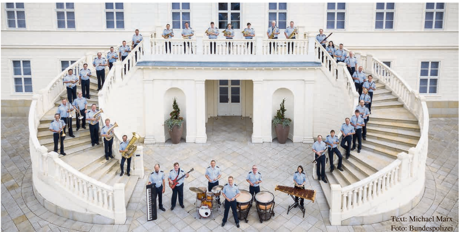
Text: Michael Marx

Das Konzert beginnt um 19 Uhr. Der Einlass erfolgt ab 18.30 Uhr. Eintrittskarten zum Preis von 10 Euro pro Person können Sie an der Abendkasse oder ab 8. Oktober 2018 im Vorverkauf im Rathaus, der Touristinformation und im Geschäft „Der gute Blumen-Geist“ erwerben.