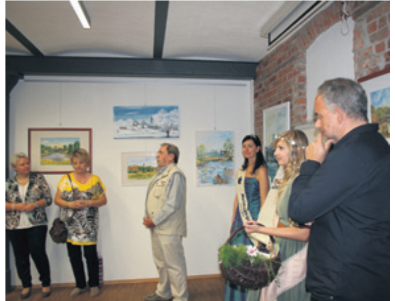
Fotoausstellung „Die Brücke – Verbindungsweg zur Kur“ von Rainer Gottwald Die Ausstellung kann noch bis 24. Oktober 2015 besucht werden.